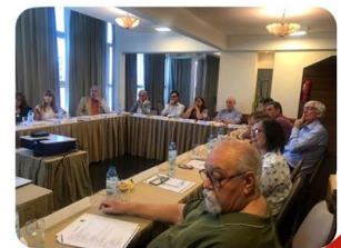
Disertantes y asistentes de la Actividad SENIOR 2019