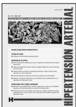
La imagen de tapa ha sido seleccionada de SIIC Art Data Bases: Esther Messer, «Corazón roto», óleo sobre tela, 2019.